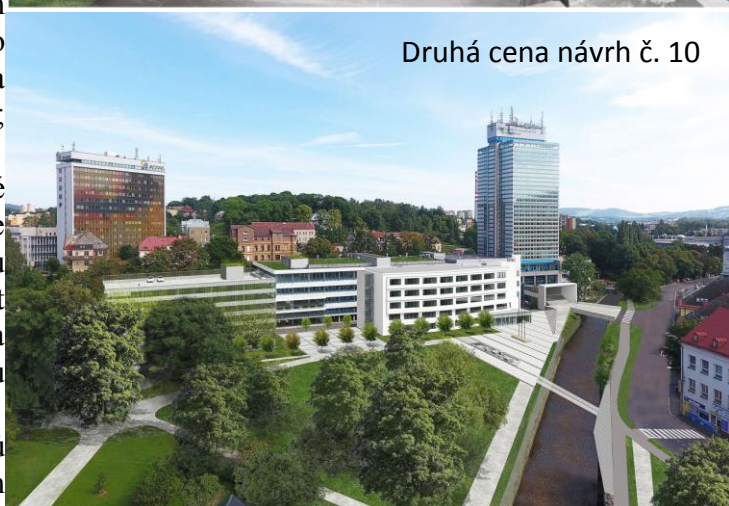
Druhá cena návrh č. 10