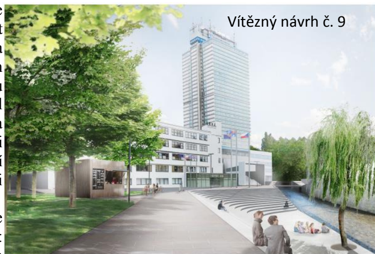
Vítězný návrh č. 9

Porota doporučuje, aby do navazujícího jednacího řízení bez uveřejnění byli vyzváni ocenění účastníci postupně, nejprve vítěz soutěže o návrh. Porota dále doporučuje, aby zadavatel pro