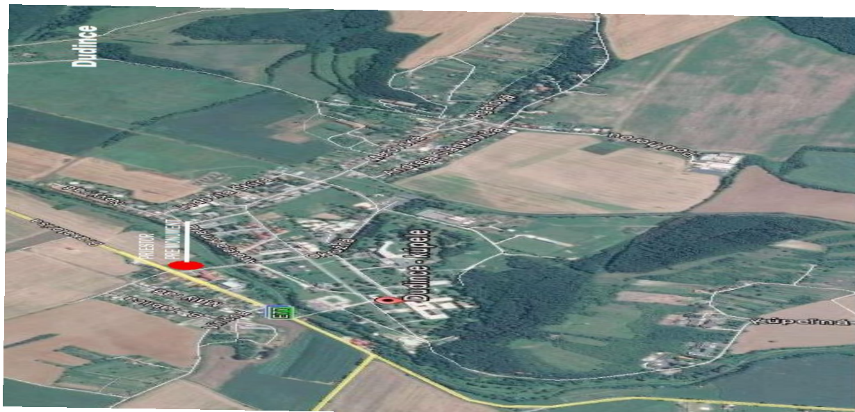
Ortofoto mapa Dudiniec s vyznačením priestoru pre situovanie uvítacieho monumentu

tu široké spektrum ochorení: kardiovaskulátorne, ochorenia pohybového aparátu, neurologické ochorenia, choroby profesionálneho preťaženia a prevencia proti týmto ochoreniam. Pri jednom liečebnom pobyte sa práve preto Kúpele Dudince zameriavajú na liečbu napr. ischemickej choroby srdca, stavu po infarktách srdcového svalu, vysokého krvného tlaku, ale aj na liečbu degeneratívnych resp. zápalových ochorení pohybového aparátu a neurologických chorôb. Dudince patria medzi slovenské kúpele s najteplejšou klímou s najmenším počtom veterných a najväčším počtom slnečných dní v roku. Malá nadmorská výška a poloha na rovine s pahorkatým okolím spôsobujú že klíma je typicky nížinná, veľmi teplá. Priemerná oblačnosť v priebehu roka je pomerne malá a okolie Dudiniec má dlhý slnečný svit, priemerne 1987 hodín v roku. Dudinciach patria k najtichším a najpokojnejším kúpeľným mestám s ekologicky najčistejším prostredím s množstvom zelene.