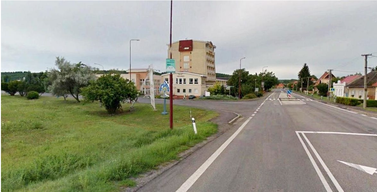
Pohľad na križovatku pri vstupe do mesta zo severovýchodu

Súčasný stav je nedostatočný - nezodpovedajúci významu tohto územia a mesta. Momentálne sa tu nachádza pútač, ktorý sa pred pár rokmi na tomto mieste vybudoval ako dočasné riešenie.