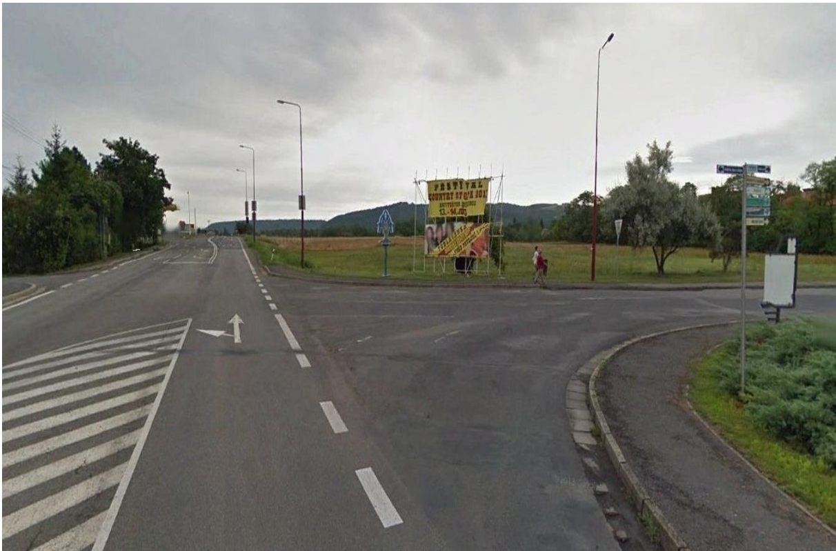
Pohľad na križovatku z juhovýchodu

Cieľom vyhlasovateľa súťaže návrhov je získať kvalitné riešenie monumentu - pútača na vysokej architektonickej a výtvarnej úrovni, ktorého realizácia bude zodpovedať súčasným materiálovým a technickým možnostiam