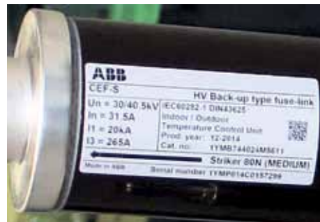
Detailné snímky označenia nových poistiek