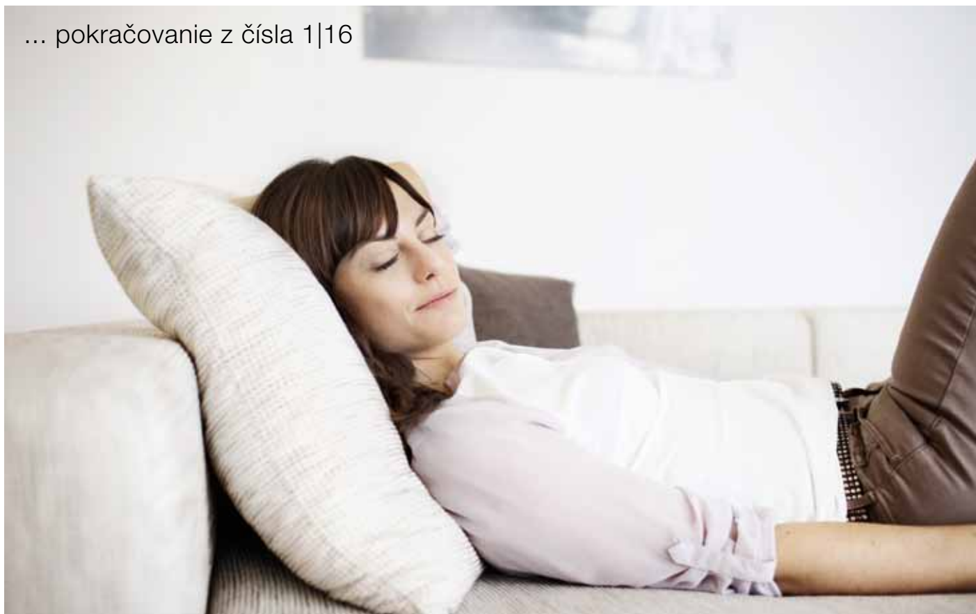
ABB-free@home® Inteligentná elektroinštalácia jednoduchšia ako kedykoľvek predtým

T oto je naozaj praktický a jednoduchý systém pre každodenné používanie. S ABB-free@home® môžete celý domov riadiť nielen pomocou spínačov, ale tiež prostredníctvom počítača, mobilu alebo tabletu odkiaľkoľvek, kde dosiahne internet. Systém sa môže neustále prispôbovať meniacim sa požiadavkám používateľov, čo zaručuje bezpečnosť a možnosť úprav aj v budúcnosti.