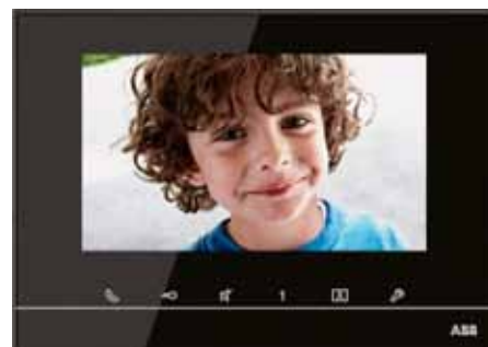
Video telefón s dotykovou obrazovkou 7"

Mimoriadne zaujímavým novým prístrojom je kamerové rozhranie, ku ktorému je možné pripojiť až 4 analógové kamery a sledovať ich obraz na displeji. Prijemným doplnkom pre montážnych pracovníkov je adaptér na DIN-lištu, do ktorého sa dá pripevniť kamerové rozhranie, vstavaný spínací modul alebo rozdeľovač video signálu.