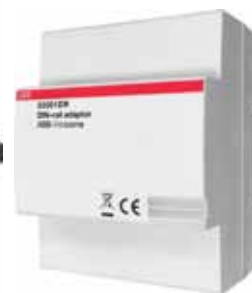
Adaptér na DIN lištu