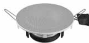
Reprodukory na inštaláciu do stropu sú vhodnejšie do väčších priestranstiev