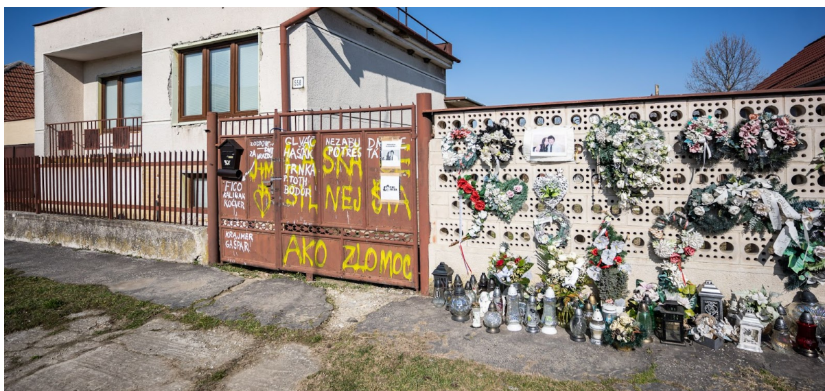
Obr. 3: Fotografia vstupnej brány - súčasný stav