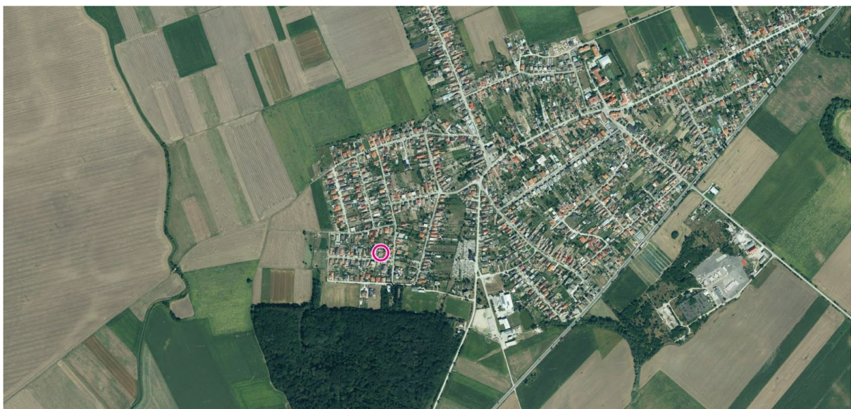
Obr. 4: Letecký pohľad širších vzťahov na riešené územie

Obec Veľká Mača sa nachádza na Podunajskej nížine v okrese Galanta. V súčasnosti tu žije vyše 2600 obyvateľov. Obec má celkovo pokojný vidiecky charakter. Cez obec prechádza cesta I. triedy 62, ktorá spája mestá Sereď a Senec. Cesta severne od Veľkej Mače mimoúrovňovo križuje rýchlostnú komunikáciu R1.