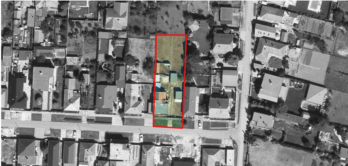
Obr. 1: Letecký pohľad na riešené územie

Riešené územie zahŕňa oplotené parcely vrátane samostatne stojaceho rodinného domu (súpisné č.: 558) a príľahlý vstupný pozemok o spoločnej rozlohe približne 1020 m 2 . Oplotený pozemok pozostáva z parciel č. 2818/269, 2818/268 a 2818/417 a je rovinatého charakteru. Vstupná časť na riešené územie je na obecnej parcele č. 2818/155. Pozemky sa nachádzajú v zastavanom území obce Veľká Mača (okres Galanta) na Brezovej ulici. Jedná sa o charakteristickú zástavbu 2. polovice 20. storočia samostatne stojacich 1-2 podlažných rodinných domov so záhradami. Nachádza sa na západnom okraji obce, severne od Mačianskeho háju. Brezová ulica ako aj širšie okolie vykazuje vidiecky, pokojný charakter s prevažne obytnou prípadne rekreačnou funkciou.