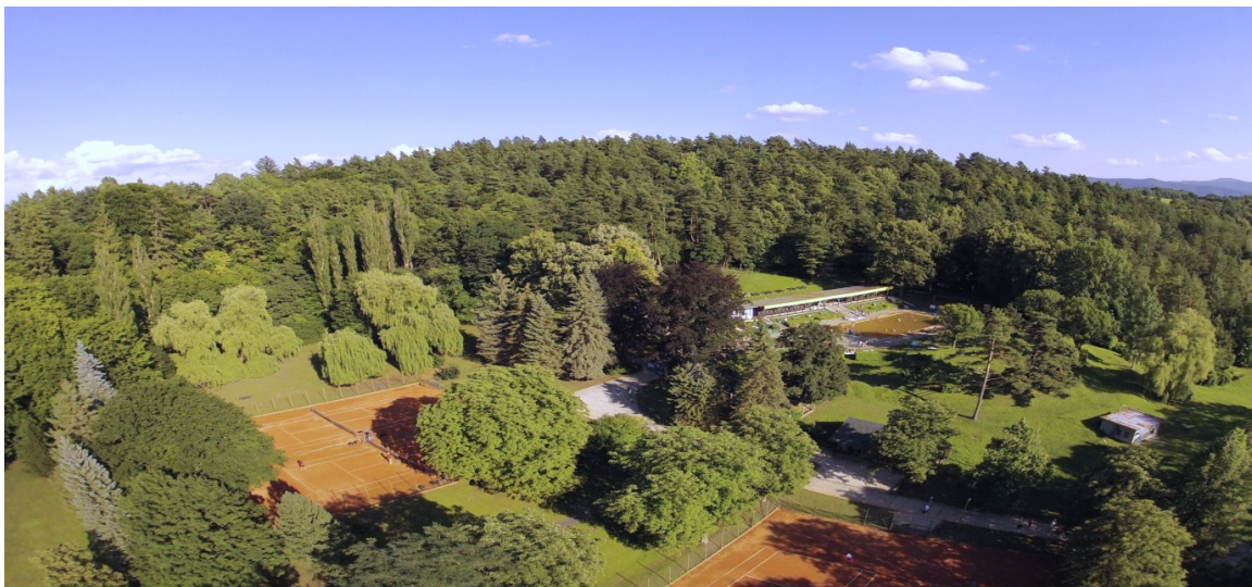
Obrázok 19: Kúpeľný park - kúpalisko