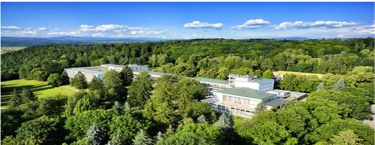
Obrázok 5: Letecký pohľad na komplex LD Palace

Komplex Palace bol vybudovaný v tridsiatych rokoch minulého storočia v štýle funkcionalizmu podľa návrhu pražského architekta Rudolfa Stockara. Stravovacia a spoločenská časť orientovaná smerom do nádvorja (jedálne, kaviareň, divadlo) objektu bola postavená v rokoch 1928 – 1930, ubytovacia (KH Palace *** ) v rokoch 1931 – 1943. Od roku 1998 je komplex Palace vyhlásený za národnú kultúrnu pamiatku a zachoval si v areáli kúpeľov dominantné postavenie. Súpisné číslo stavby 714, nachádza sa na parcele č. 469.