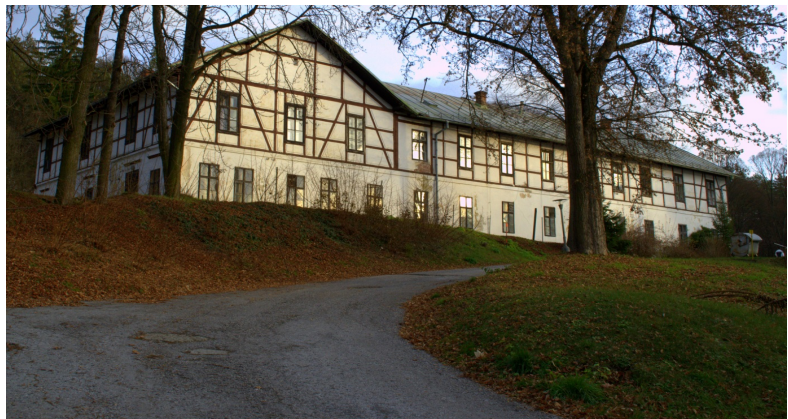
Obrázok 26: Starý Partizán

KPÚ odporúča zachovať, rekonštruovať a prezentovať historický architektonický výraz stavby vrátane hodnotných historických konštrukcií, detailov a povrchových úprav v exteriéri. Vzhľadom na stav objektu a jeho polohu vyhlasovateľ pripúšťa v súlade so statickým posudkom aj jeho asanáciu za účelom iného využitia priestoru tejto časti územia.