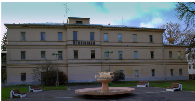
Obrázok 22: LD Bratislava

Predpokladaná kapacita 45 lôžok (odhad - po úpravách dispozície).