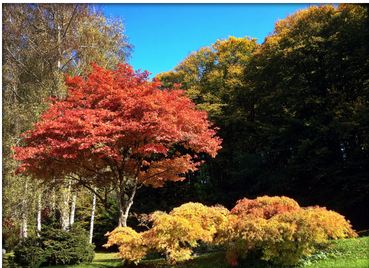
Obrázok 18: Kúpeľný park