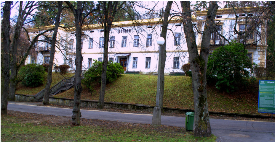
Obrázok 8: LD Poľana

Súpisné číslo stavby 716, nachádza sa na parcele č. 468. Objekt je využívaný ako ubytovacie zariadenie.