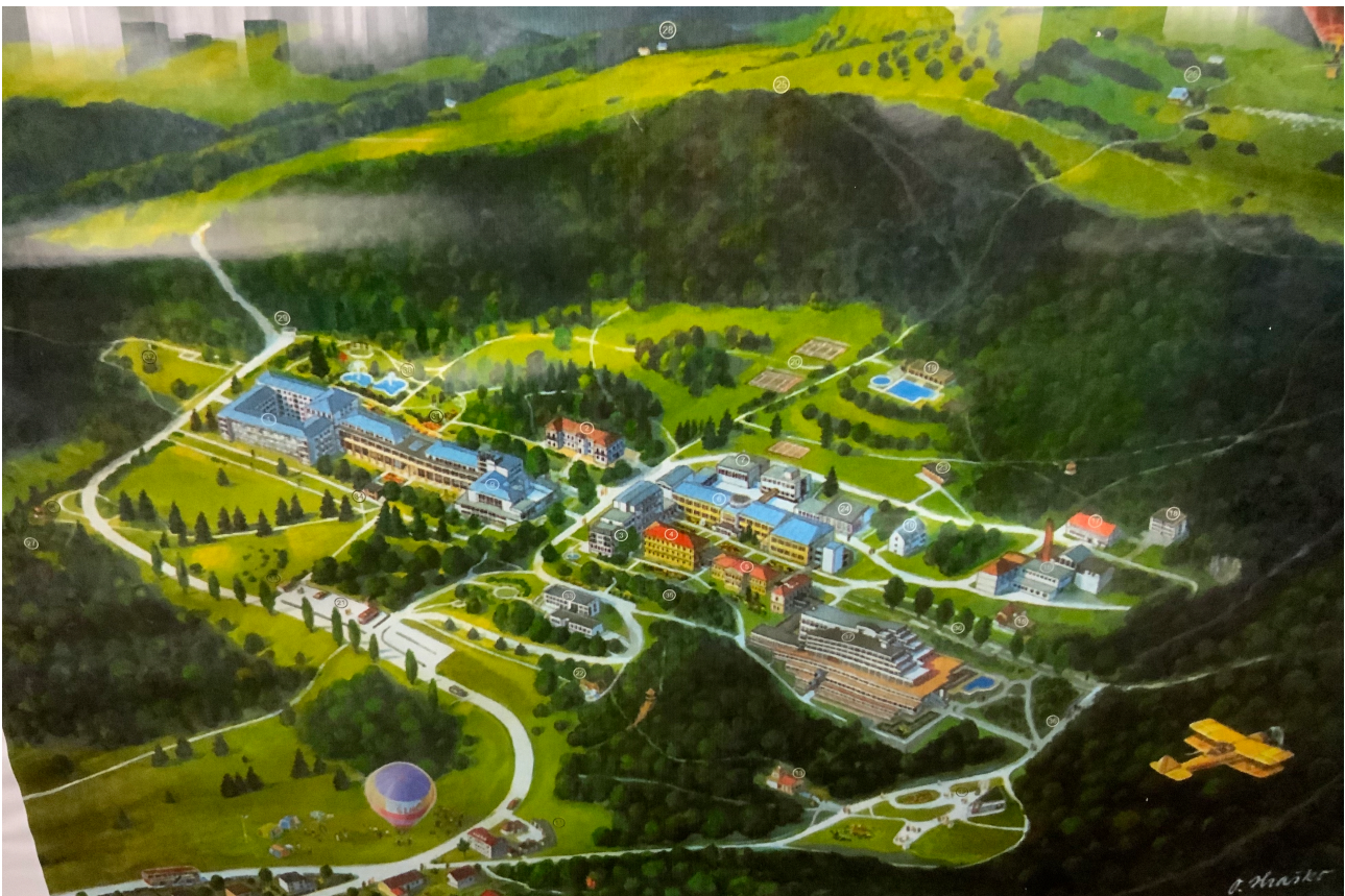
Obrázok 3: Pohľad na areál

Kúpele Sliac majú ambíciu zaradiť sa medzi jedinečné kúpeľné areály v Európe. Svojou históriou, polohou, územným rozsahom, kvalitou vody sa radia medzi popredné kúpeľné areály v európskom meradle.