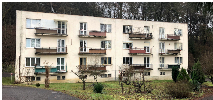
Obrázok 14: Nový Partizán

Súpisné číslo stavby 729, nachádza sa na parcele č. 448 a 449. Objekt je využívaný ako bytový dom pre zamestnancov s 12 bytovými jednotkami.