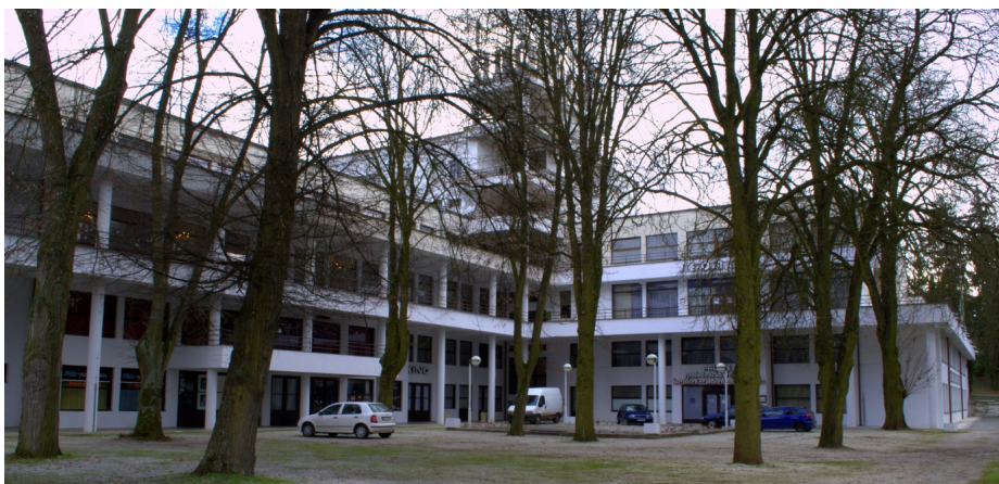
Obrázok 6: Pacientské jedálne a kuchyne

Vo vrchných podlažiach sa počíta s vytvorením priestorov pre vedenie kúpeľov Sliac.