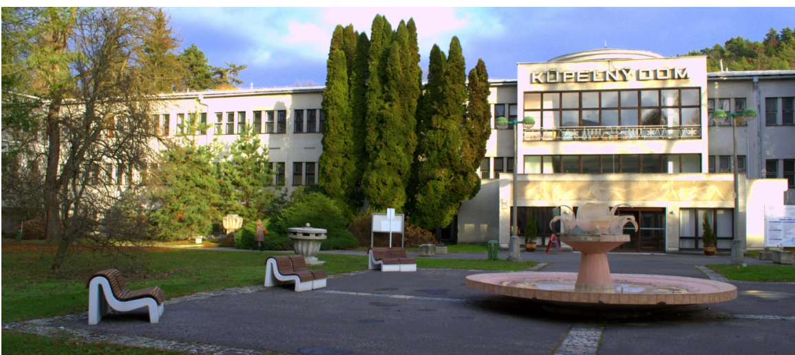
Obrázok 9: Kúpeľný dom 1

Súpisné číslo stavby 716, nachádza sa na parcele č. 468. Objekt je využívaný na rehabilitáciu pacientov.