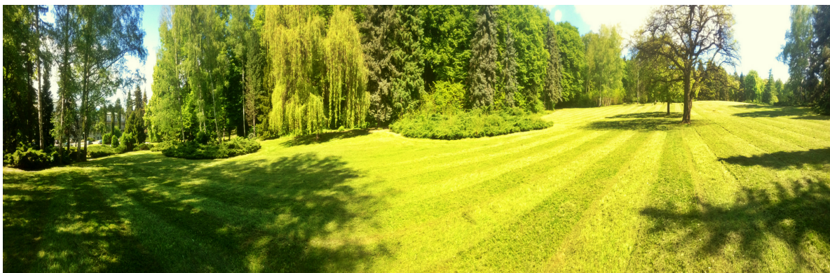
Obrázok 15. Kúpeľný park - zelené priestory