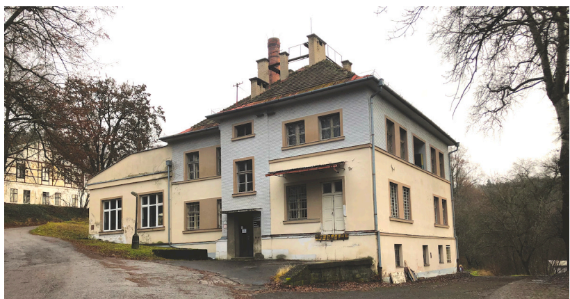
Obrázok 11: Kotelňa a práčovňa

Vyhlasovateľ počíta s vymiestnením funkcie kotolne a práčovne do iného objektu. Počíta sa so zachovaním severnej časti (vilovej stavby), ostatná stavba a jej poňatie je ponechané na návrh uchádzača, je prípustná aj asanácia. Existujúci pôvodný komín kotolne je možné využiť pre umiestnenie rozhladne (pokiaľ zapadne do koncepcie).