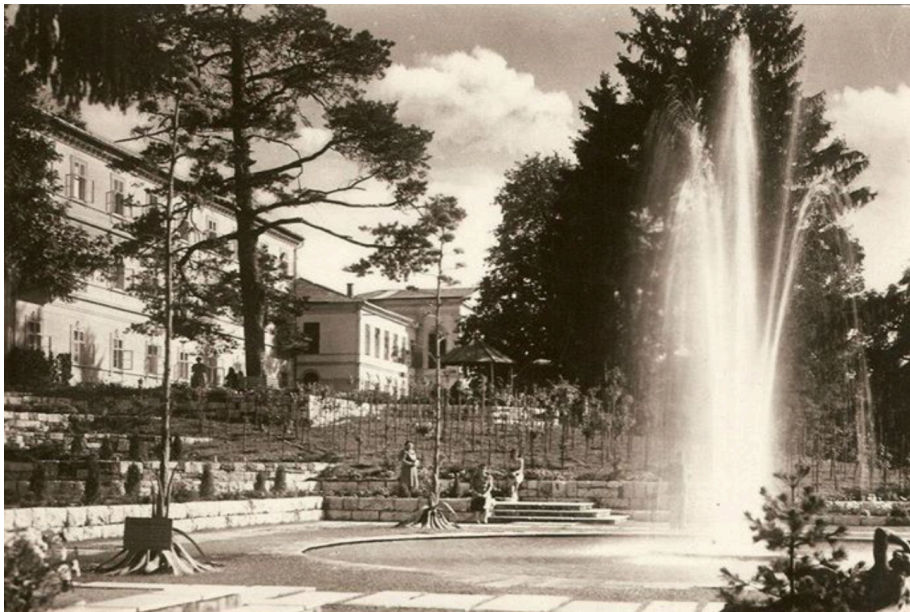
Obrázok 2: Historická fontána pred DKL Slovensko