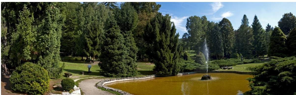
Obrázok 16: Kúpeľný park - jazierko pred LD Palace