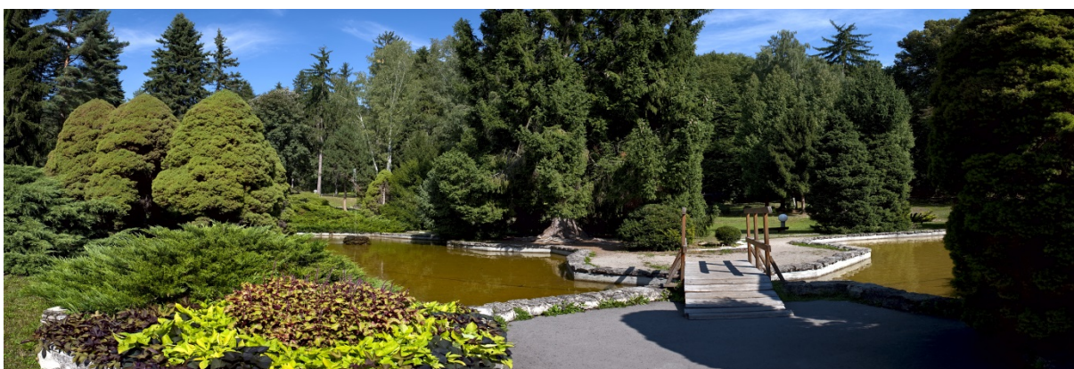
Obrázok 17: Kúpeľný park - jazierko pred LD Palace