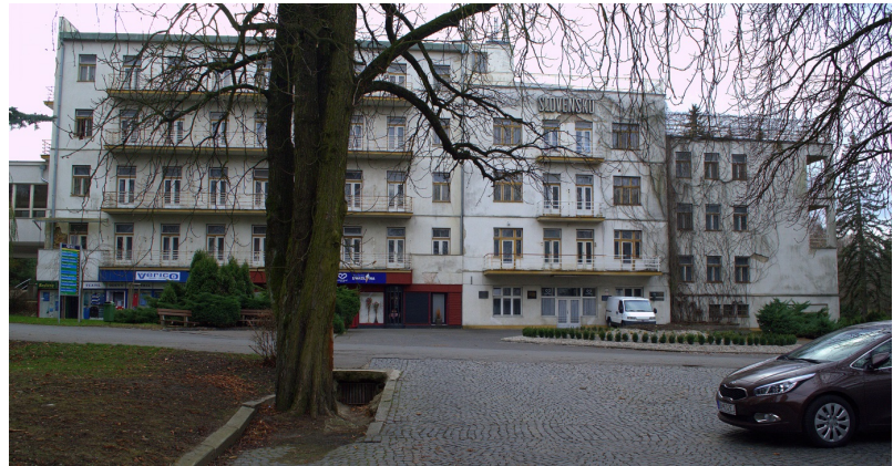
Obrázok 21: LD Slovensko

Predpokladaná kapacita 100 lôžok (odhad - po úpravách dispozície).