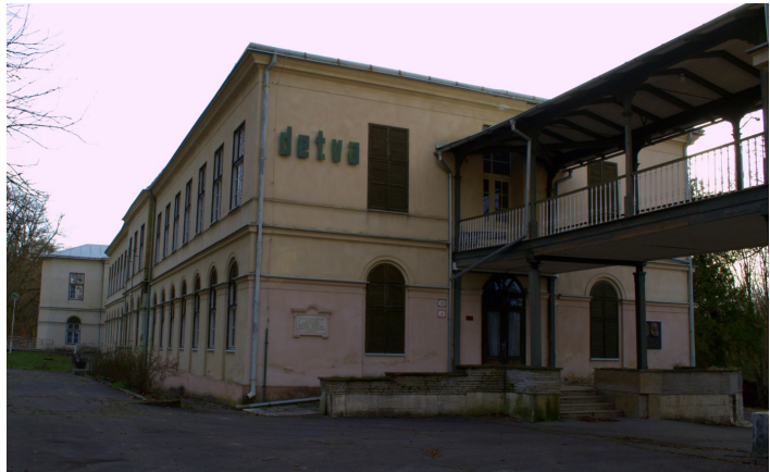
Obrázok 23: LD Detva

Predpokladaná kapacita 40 lôžok (odhad - po úpravách dispozície) - v tomto objekte možno izby luxusnejšieho charakteru