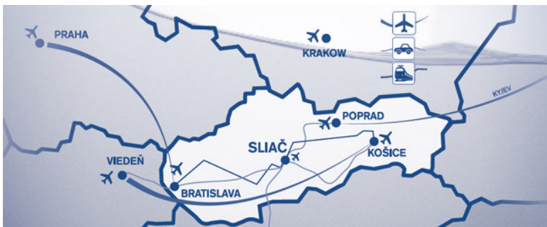
Obrázok 1: Mapa leteckých spojov

V tesnej blízkosti Kúpeľov Sliáč, v ich susedstve na juhu sa nachádza vzácne "Arborétum Borová hora", ktoré je prístupné z mesta Zvolen a jeho areál takmer susedí s areálom Kúpeľov. Dva kilometre severne od mesta Sliáč sa nachádza 18-jamkové Golfové ihrisko Hron-Tri Duby.