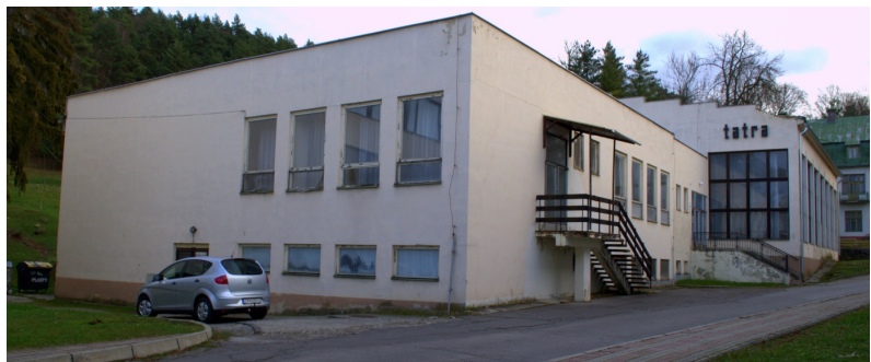
Obrázok 27: Tatra - stravovacia prevádzka

Vyhlasovateľ v rámci návrhu plánovaného rozšírenia Kúpeľného domu a prístavby balneoterapie počíta s jeho úplnou asanáciou s uvoľnením pozemku pre funkciu nových bazénov s príslušenstvom.