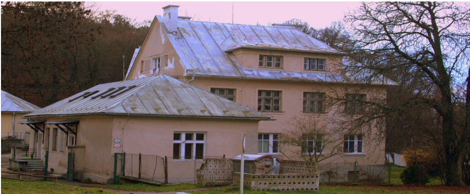
Obrázok 12: Hospodárska budova

Súpisné číslo stavby 733, nachádza sa na parcele č. 423. Objekt je využívaný ako bytový dom pre zamestnancov s 12 bytovými jednotkami.