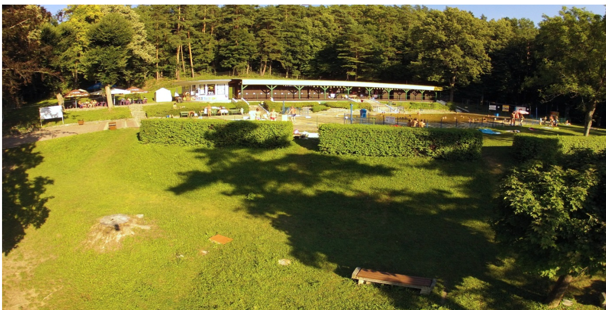
Obrázok 29: Kúpalisko