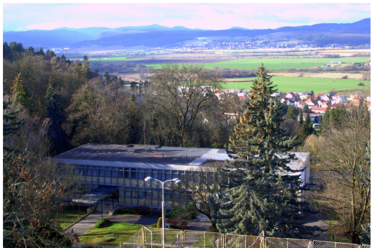
Obrázok 24: Administratívna budova

Budova v súčasnosti nemá využitie a vyhlasovateľ s jej využitím nepočíta, vedenie a administratíva Kúpeľov Sliač bude mať nové priestory v najvyšších podlažiach spoločenskej časti