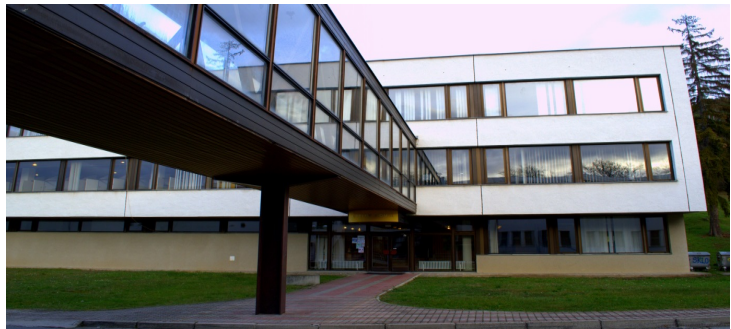
Obrázok 10: Kúpeľný dom 2 (prístavba balneoterapie)

Vyhlasovateľ počíta so zachovaním funkcie kúpeľného domu na tomto mieste pre kapacitu pre finálnu kapacitu kúpeľov - 1200 pacientov. V budove by mali byť umiestnené ambulancie lekárov.