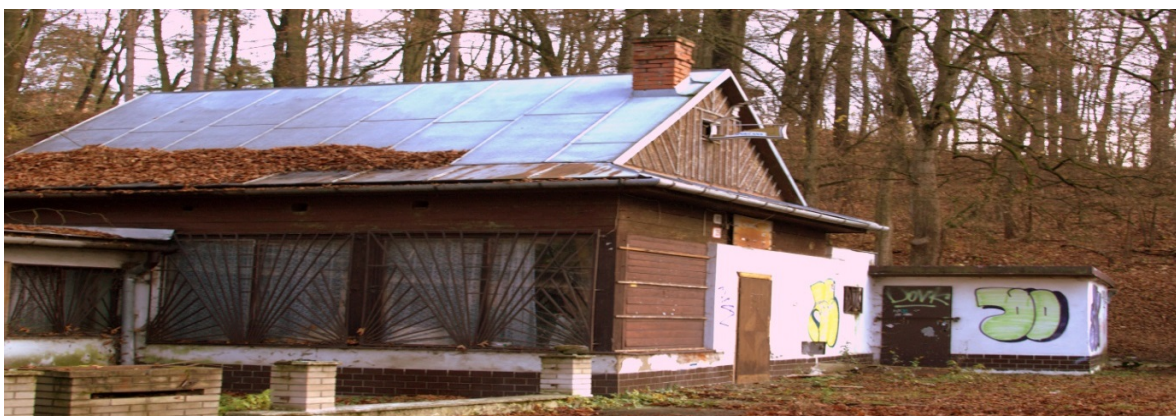
Obrázok 28: Bufet a kolkáreň

Súpisné číslo stavby 883, nachádza sa na parcele č. 483. Objekt bol využívaný ako spoločensko-reštauračné zariadenie, od roku 2003 sa už nevyužíva.