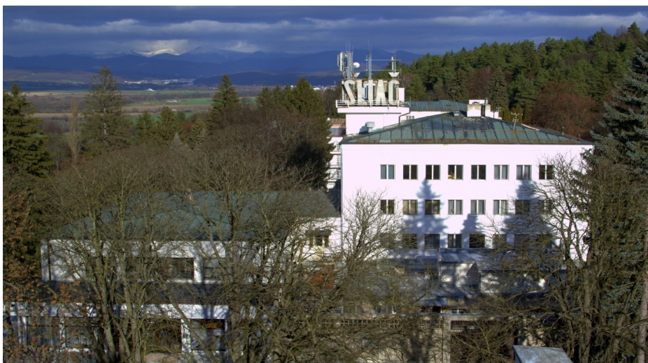
Obrázok 7: Pacientské jedálne a kuchyne