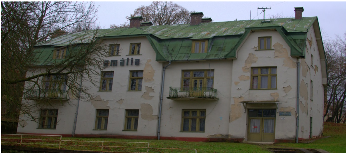
Obrázok 25: LD Amália

Súpisné číslo stavby 726, nachádza sa na parcele č. 457. Objekt bol kedysi využívaný ako turistická ubytovňa.