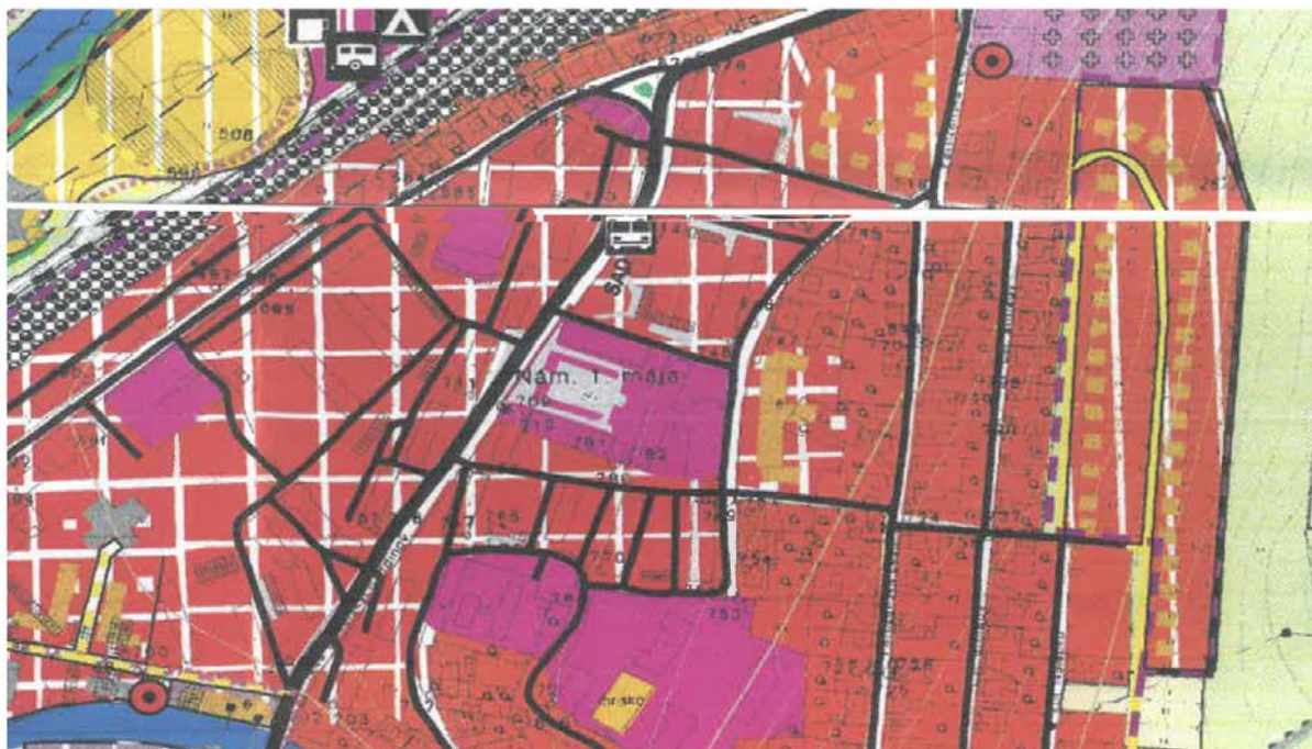
Výrez z Územného plánu sídelného útvaru Valaská – Komplexný urbanistický návrh