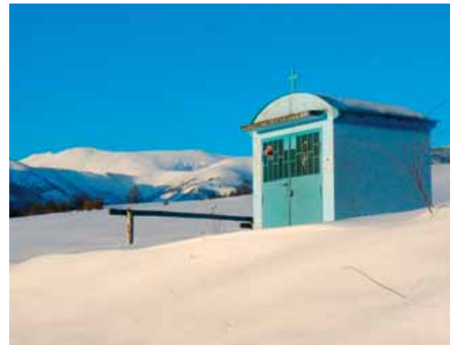
Kaplnka na Pohánskom zasvätená Panne Márii Pomocníci

Ďalšou stavbou je kaplnka postavená po 2. svetovej vojne v roku 1946 v lokalite Pohánsko (podľa informátorov z vďačnosti obyvateľov Mýta pod Ďumbierom za to, že obec nebola zničená počas evakuácie po oslobodení). Ide o železobetónovú stavbu obdĺžnikového pôdorysu ukončenú apsidou, v ktorej sa nachádza malý oltárik. Z obdobia 2. svetovej vojny treba spomenúť ešte sedem zachovaných bunkrov zo železobetónu, ktoré postavilo povstalecké vojsko v spolupráci s miestnym obyvateľstvom kvôli obrane pred prípadným postupom nemeckej armády do doliny obce Mýto pod Ďumbierom smerom od Čertovice.