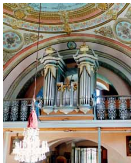
Interiér rím. kat. kostola, organ s ornamentálnou výzdobou

Pri hodnotení architektúry obce treba spomenúť aj dodnes zachované salašné koliby mimo intravilánu obce a takisto aj pastierske prístrešky, ktoré sa však nedochovali. Koliby sú drevené zrubové stavby postavené väčšinou z neopracovaných trávov s kruhovým prierezom a polvalbovou strechou. Mnohé z nich boli vystavané začiatkom a v priebehu 20. storočia, zrejme na pôvodných miestach starších stavieb, a to hlavne kvôli prístupu k vode a vyhovujúcim terénnym danostiam. Niektoré boli budované aj vo vyšších polohách, priamo pod hoľami Ďumbierskeho masívu, ako napr. „Pasecký salaš“ pod Veľkým Gáplom, ktorého obvodové murivo a zborenú strechu bolo možné vidieť ešte v prvých rokoch tohto storočia. Mýto pod Ďumbierom sa javí ako miesto s najhustejším výskytom tohto typu stavieb v rámci regiónu Horehronia. V čase zostavovania monografie