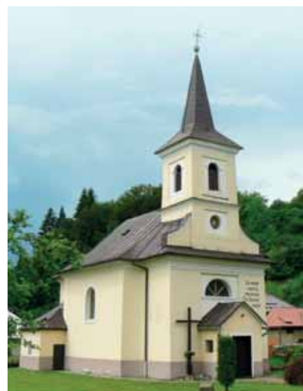
Historické foto rím. kat. školy, v súčasnosti rím. kat. fara KrRKŠ (s. 67)