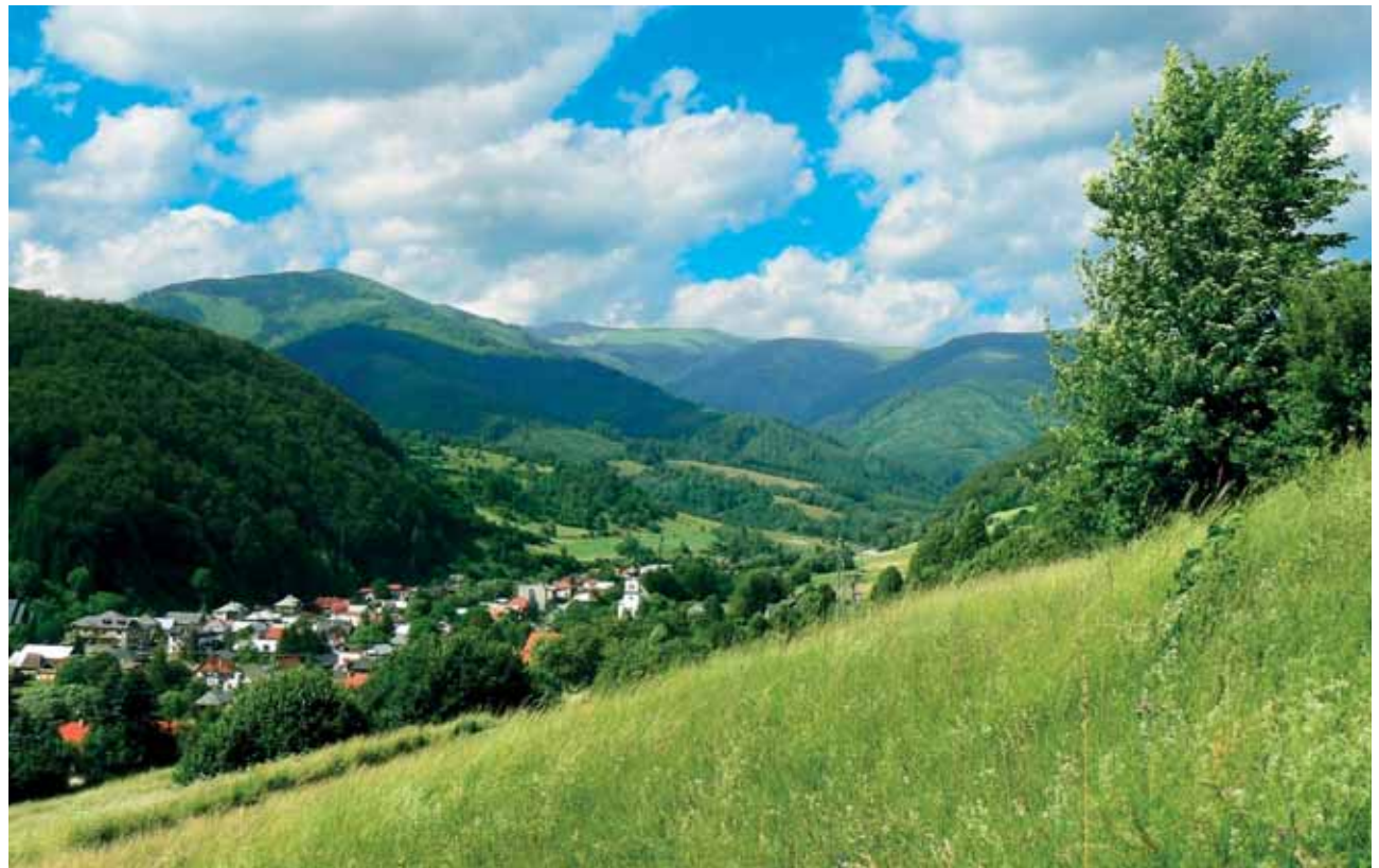
Veduta Mýta pod Ďumbierom

Základy osídlenia obce sa začali budovať od konca stredoveku v blízkosti banských diel, ale zrejme aj pri staršej komunikácii vedúcej cez čertovický priesmyk smerom z Pohronia na Liptov. Samotný názov obce Mýto vystihuje jeho funkciu, keďže ide o miesto, kde sa vyberá poplatok za strážený a udržiavaný prejazd. Nešlo o typickú radovú výstavbu ako v iných obciach tohto regiónu, ale o účelové umiestnenie budov pri mieste kontroly cestujúcich, teda v mieste výberu mýta či pri prevádzke povrchovej ťažby drahých kovov. Jednotlivé obydlia v obci boli usporiadané dosť nepravidelne po oboch brehoch potoka Štiavničky, rešpektujúc zložitý terén so starými banskými haldami pozdĺž toku. Tieto okolnosti podmienili rozširovanie sídla špecifickou formou, ktorú pozorujeme najmä pri banských osadách a ktorá ovplyvnila jeho ďalšie budovanie do dnešnej podoby. Je dosť pravdepodobné, že prvé stavby boli prevažne obydliami baníkov. 146