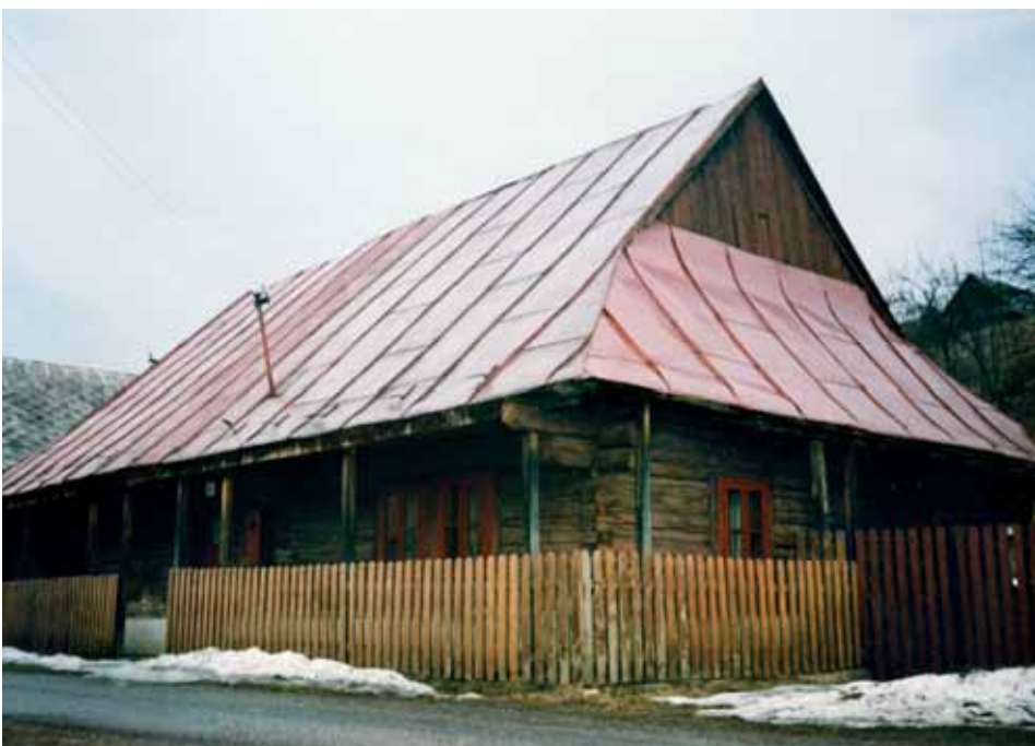
Ukážka tzv. baníckeho zrubového domu s centrálnou dispozíciou Foto I. Faško 2001

Tretím typom zástavby sú obytné murované domy. Ich výstavba sa rozšírila najmä v období medzi dvoma svetovými vojnami a začala postupne vytlačovať pôvodnú drevenú architektúru. Dispozícia týchto stavieb však bola podobná dreveným zrubovým. Za nówum možno považovať skutočnosť, že boli aj podpivničené. Pivnice sa predtým budovali samostatne, väčšinou zakopaním do hĺbky vo svahoch. V medzivojnovom období vzniká v Mýte pod Ďumbierom špecifická výstavba, ktorá akoby sa pridržala jednej schémy či majstra staviteľa z tejto doby. Pre domy je charakteristická pozdĺžna trojpriestorová dispozícia so vstupom cez pavlač, líšia sa len rozdielnym prevedením fasád. Na niektorých je napr. možné pozorovať zdobenie secesnými vzormi. Strechy týchto obydlí sú často už iba sedlové, bez podlomeníc. V štítoch, ktoré boli najskôr doskové, sa niekedy objavujú veľmi precízne vyhotovené drevené vyrezávané okrasy, napr. v tvare kríža alebo srdiečok, v neskorších murovaných štítoch sa táto výzdoba vyskytuje ojedinele.