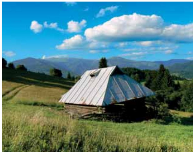
Salašná koliba na Diele Foto I. Faško 2012

K zaujímavým stavbám v extraviláne obce patrí aj bývalý televízny vysielateľ, ktorý kedysi plnil funkciu retranslačnej stanice pre zosilnenie televízneho príjmu. Bol postavený zo železobetónu v kruhovom pôdoryse pravdepodobne začiatkom 60. rokov 20. storočia v lokalite Skalka-Diel. Táto stavba je zaujímavá riešením veže s kruhovým pôdorysom, ktorá je ukončená tromi kruhovými balkónmi, takisto zo železobetónu.