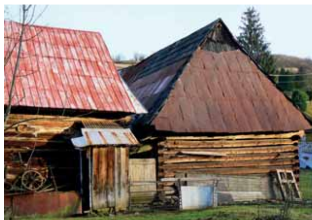
Humno presťahované z lokality Pohánsko do intravilánu obce