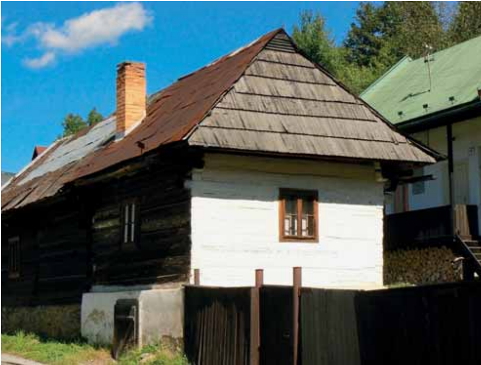
Jednopriestorový zrubový dom Foto I. Faško 2010

Klasický vstup do domu bol vytvorený cez gang (pavlač) a v strede dispozície umiestnený pitvor (neskôr kuchyňa), kde sa nachádzala rohová pec. K najstarším typom patrili otvorené pece, tzv. ohniská, s otvorom cez strop, bez komína. Dym stúpал voľne do podkrovia a cez strechu vychádzal tzv. dymníkmi. Vzhľadom na tento nebezpečný spôsob odvodu spalín a časté požiare sa postupne začali v dôsledku nariadení budovať komíny a postupne sa zmenil aj tvar pecí, ktoré dostali pomenovanie šparhét . Pri trojpriestorovej dispozícii sa zo vstupného priestoru vchádzalo do väčšej miestnosti – izby, ktorá bola zároveň obytnou miestnosťou aj spálňou. Na druhú stranu sa vchádzalo do komory, ktorá slúžila na uskladnenie potravín, náradia a iných dôležitých hospodárskych potrieb. Táto miestnosť v zadnej časti domu sa niekedy využívala aj na iné účely, najčastejšie sa zmenila na obytnú izbu.