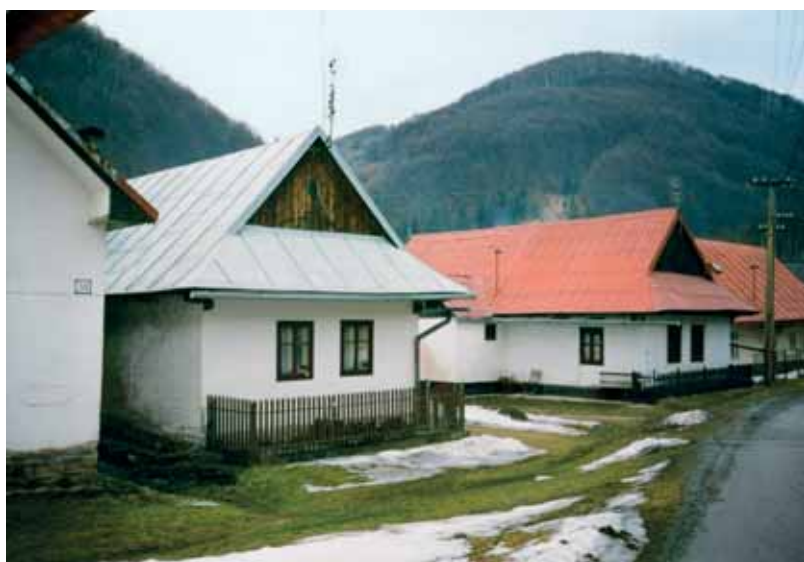
Typická uličná zástavba obce, štíty domov orientované kolmo na ulicu 2001