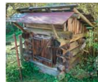
Drevená zrubová studňa