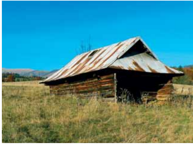
Salašné koliby v lokalitách Pohánsko a Šánske