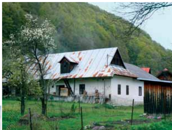
Ukážka murovaného tzv. banického domu z obce Jarabá, asanovaného prednedávnom Foto I. Faško 2010