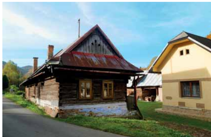
Typická zástavba uzavretého dvora 2017

K najstarším a najpočetnejším dochovaným obytným stavbám patria klasické drevené zruby s pozdĺžnou dispozíciou, ktoré sú niekedy omietnuté vápennými omietkami. Zruby s pozdĺžnou dvoj- či trojpriestorovou dispozíciou ako produkt valašskej kolonizácie v tomto horskom prostredí bývajú niekedy označované aj