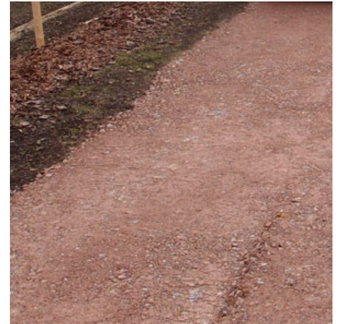
MÓLO - mlatový povrch