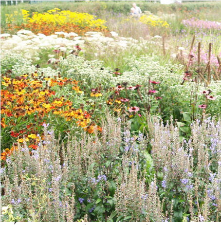
LÚKA - nepriestupnosť