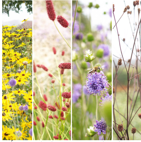
LÚKA - druhová rozmanitosť