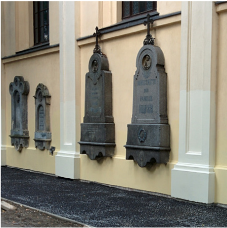
KAPLNKA - ornament najdeným