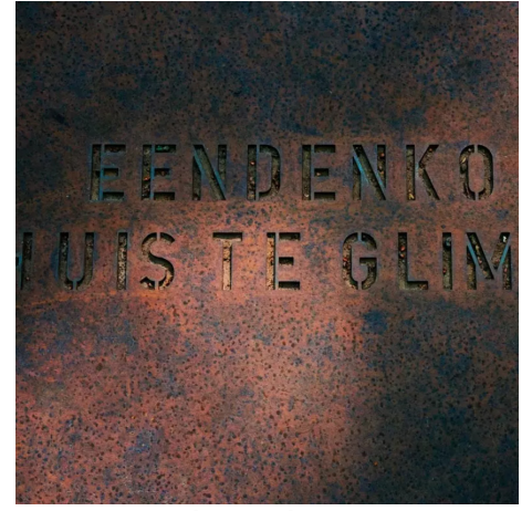
TEXT -gravírovaný v cortene