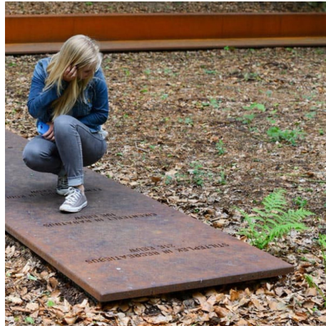
STEPPING STONES - corten